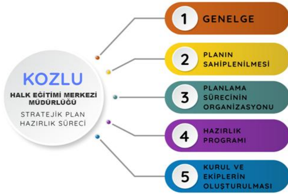
Şekil 1: Halk Eğitimi Merkezi Müdürlüğü Stratejik Plan Hazırlık Süreci

Hazırlık dönemindeki çalışmalar aşağıdaki konuları içermektedir: